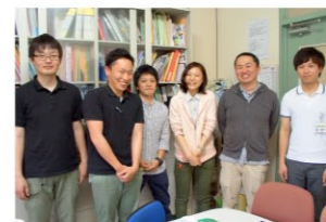
こだま病院作業療法士の皆さん。雰囲気の良い方が伝わります。