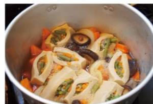
料理教室で作った熱々の料理。

「精神科では、料理や農作業、モノ作り、レクリエーションなどを行います。モノ作りは、女性であればシュシュや手芸、マスコットなどの裁縫が多いです。音楽を聴いたり、自己表現ができるように雑誌を切り抜いてコラージュをしたりもします。私が精神科を選んだ一番の理由は、実習で「楽しい」と感じたからです。」