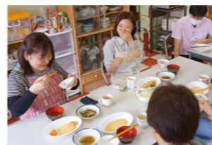
調理後の試食では、参加者の楽しそうな笑顔が印象的。