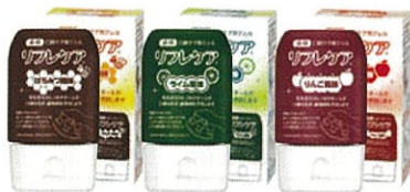
薬用 口腔ケア用ジェル リフレケア

ケアの語源は「思いやり」です。しかし認知症ケアの中で、「食の楽しみ」を考えることはあっても「健やかな口腔」を考えることが案外少ないのではないのでしょうか。いま、毎日歯みがきをしている貴方が、今後もし、歯みがきをできない状態になったら、自分だったらどうしてほしいですか？ 誤嚥性肺炎は口腔の健康を失った先にある結果のひとつです。ほかに、スムーズな会話、美味しく楽しい快適な食生活などその人らしい生活を損なう事象が起こります。認知症の方の症状の背景にあるものが何かを押し量り、そのうえで食と口腔の支援を適切に行うために何が必要か一緒に考えてみませんか。