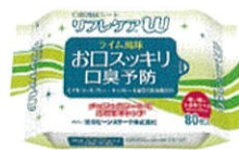
口腔清拭シート リフレケアW