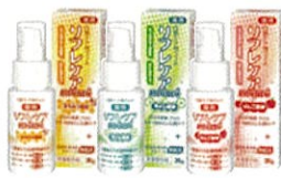
薬用 口腔ケア用ジェル リフレケア